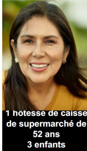
1 hotesse de caisse de supermarché de 52 ans 3 enfants