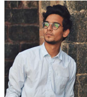
Trentenaire en reconversion Diplômé d'un master en communication