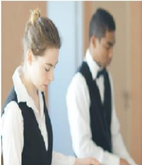
Jeune apprentie en école hôtelière